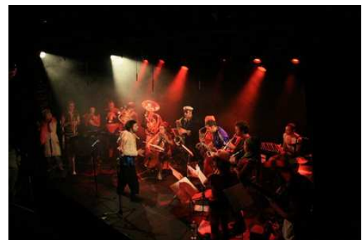
The very experimental tobifri orchestra