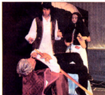
Spécialiste de l'improvisation, la troupe ET CoMPAGNIE propose aujourd'hui des spectacles pour enfants, entièrement improvisés et interactifs/

Pour la plupart des écoliers d'ailleurs, la représentation signifie l'aboutissement d'un projet pédagogique mené tout au long de l'année scolaire (qui entre également dans le cadre d'un projet de quartier et intègre l'implication des parents). Ainsi, les trois personnages mis en scène hier ont été élaborés par deux classes d'Alphonse-Daudet.